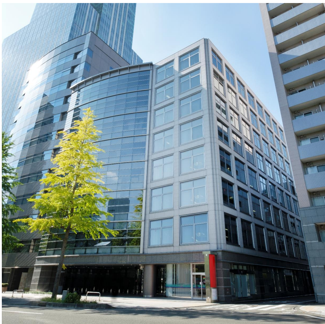
(添付資料1) 本取得物件の写真及び位置図 ＜物件写真＞